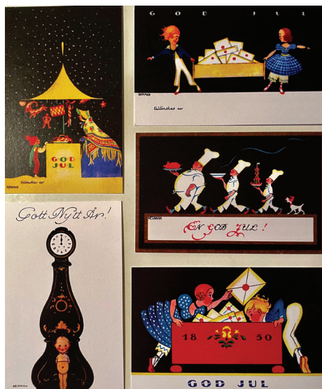
Nermans julkort med ensamrätt för Lidingö Museum