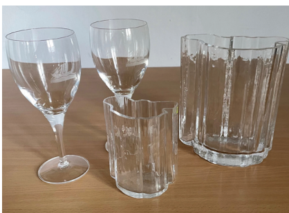
Vinglas med Lidingöskeppet. Lidingövasen (Torstenson Art & Design)