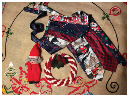
Massor med hantverk av skilda slag

dykningar i bl.a. Krigsarkivets numera avhemligade handlingar.