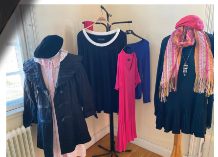
Delar av Gunilla Ponténs kollektion