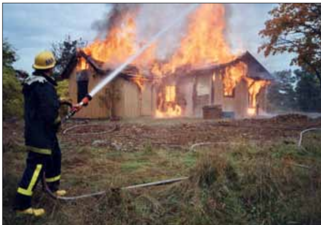
Lidingö brandkår bränner på stadens uppdrag ner mjölnarbostaden på Bredablickshöjden i oktober 2003.