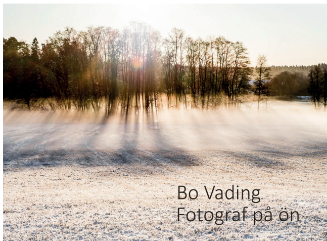
Bo Vading Fotograf på ön